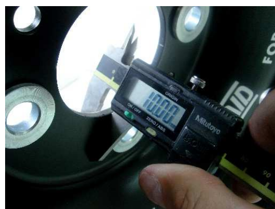
Versión 4 – VALIDA (8 ventanas pequeñas, con casquillos y chapa de 10mm)