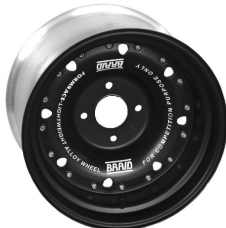
Formrace V2 – NO UTILIZABLE (8 ventanas pequeñas, sin casquillos agujeros amarre)