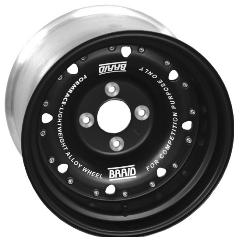
Formrace V3 – NO UTILIZABLE (8 ventanas pequeñas, con casquillos)