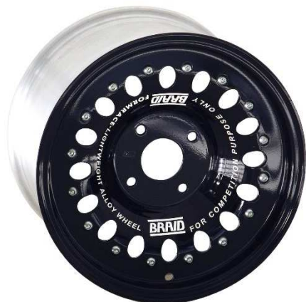
Formrace V1 – NO UTILIZABLE (16 ventanas grandes)